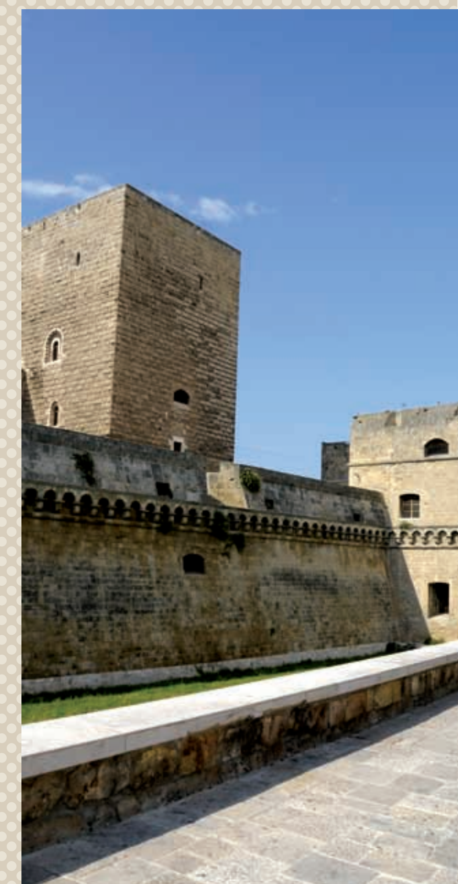
Bari, Castello Svevo-Normanno